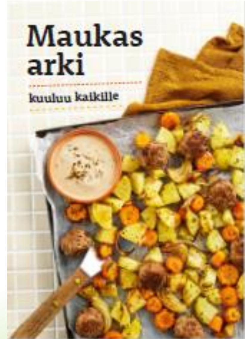
Maukas arki kuuluu kaikille | Martat

Vihkonen inspiroi järjestämään liitännäistoimina mm. ruoka- ja talouskursseja sekä avunsaajia taloudelliseen ja terveelliseen ruuanlaittoon. .